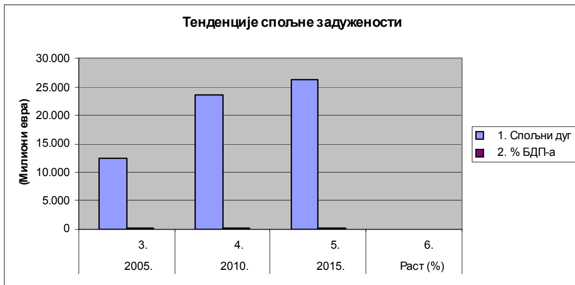
График 3. Претходни табеларни параметри; приказани прегледнијим графичким методом:

Сагледавају се континуирано растуће величине јавног и спољног дуга Србије у досадашњем периоду, са опасношћу западања у класично дужничко ропство. Посебно је питање узрока настајања великог дуга и канала којима су усмјеравана добијена инострана финансијска кредитна средства. Величина (обим, опсег) дуга, постепено се опасно приближава величини укупног бруто друштвеног производа. Једино опорављена и растућа производња и укупна привреда може да превазиђе овај претешки развојни проблем. Посебно је неповољно стање узимања нових кредита у циљу отплате доспјелих (главнице, са припадајућим каматама), чиме јача и већ галопирајућа спирала задужености.