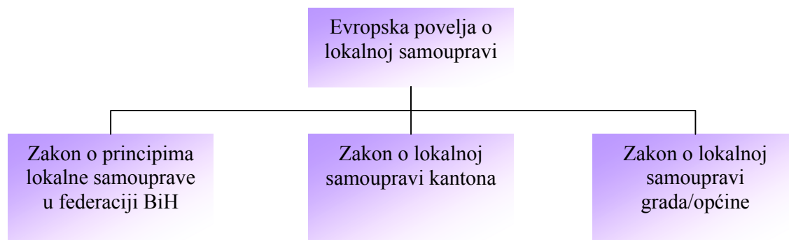
Šema 1: Propisi koji regulišu lokalnu samoupravu u Federaciji Bosne i Hercegovine

Prema definiciji Evropske povelje lokalna samouprava podrazumijeva pravo i osposobljenost lokalnih vlasti da, u granicama zakona, reguliraju i rukovode znatnim dijelom javnih poslova na osnovu vlastite odgovornosti i u interesu lokalnog stanovništva. Prema članu 4. ove Povelje, lokalne vlasti će, u granicama zakona, imati puno diskreciono pravo da provode svoje inicijative u vezi sa svim stvarima koje nisu isključene iz njihove nadležnosti, niti stavljene u nadležnost druge vlasti.